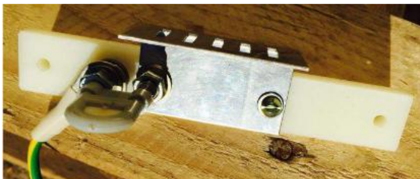
Рисунок 1. Пластина контактная

Столб предназначен для вывода на поверхность проводников сигнальнолокализационной ленты, их соединения и подключения соединения к заземлителю через пластину контактную. Пластина контактная столба позволяет отключить ленту от заземлителя и подключить к ней генератор частоты типа ГИП-1 ТУ РБ 07511293.078-99 (или аналогичного) для определения трассы трубопровода с помощью искателя ИК-1 ТУ РБ 07511293.068-98